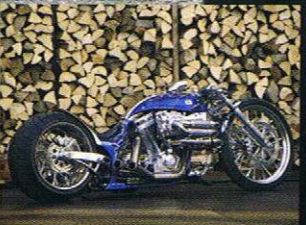
AT AMERICAN CYCLES STAGE II