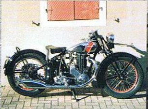
JAP-SPECIAL-SPORT TORNAX II/31