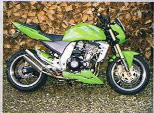
KAWASAKI Z 1000 DER Z FAKTOR